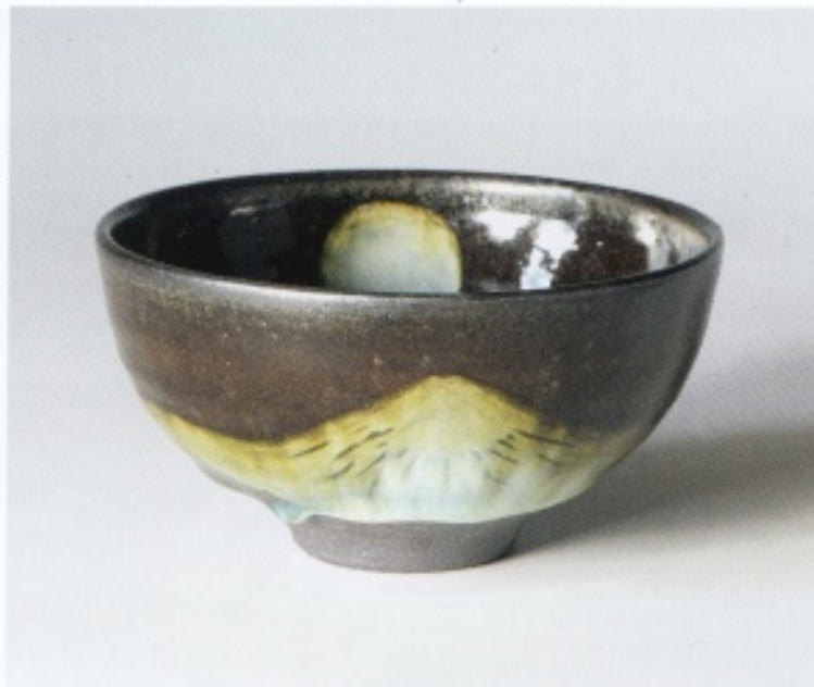
Tineke van Gils, De berg, de maan en het meer , 2024; steengoed en porselein; h. 7 cm, Ø 13 cm

zicht. Zo kan langs een omweg ook de chawan weer in beeld komen. Zelfs de onder jongeren razend populaire bubble tea, die als suikerrijke frisdrank totaal niet in verband kan worden gebracht met de oosterse thee filosofie, kent al variaties met matcha. Zo maakt een nieuwe generatie indirect kennis met de wereld van de poederthee. Wie weet, misschien gloort er ooit ook een chawan aan hun horizon. De belangstelling voor deze kom neemt in ieder geval toe en komt niet meer alleen uit de hoek van de doorgewinterde verzamelaar, maar in toenemende mate ook van een jonger en eigentijds publiek.