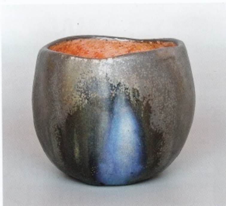
Her Cornis, Scintilla , Chawan, 2024; steengoed, houtgestookt in een anagama oven; h. 9 cm, Ø 10 cm