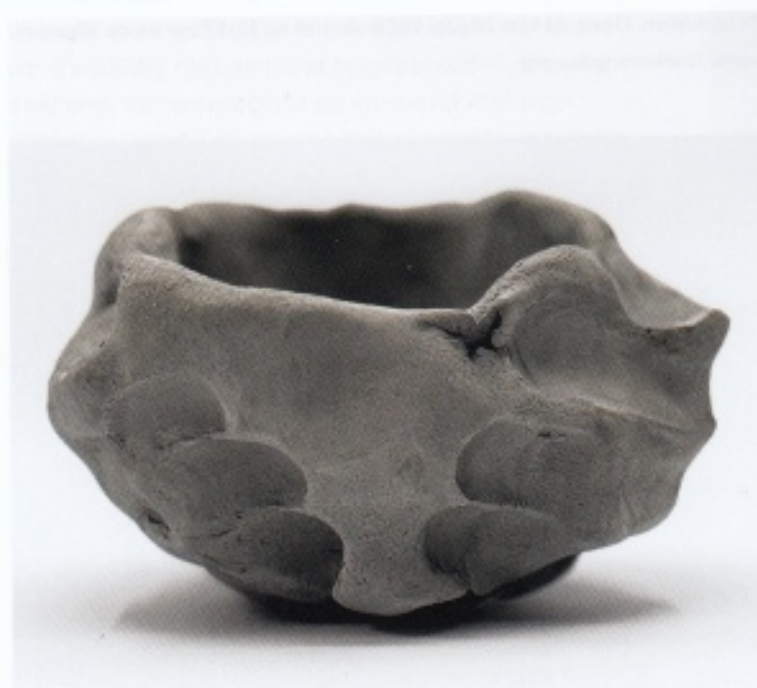
riëlle beekmans, Chawan, 2025; experiment, ongestookt; h. 7 cm, Ø 10,5 cm

De laatste jaren heeft het theedrinken in het westen een opmerkelijke opleving doorgemaakt, vooral onder jongere generaties. Er is zelfs een ware matcha-rage ontstaan, aangewakkerd door een moderne zoektocht naar gezondheid, mindfulness en esthetisch genot. Ooit was matcha alleen bekend bij kenners en mensen die vertrouwd waren met de Japanse cultuur, maar nu is het mainstream geworden. Wie matcha drinkt vanwege de vermeende gezondheidsvoordelen zal niet meteen een chawan of bamboe garde kopen, de melkschuimer van de espressomachine lijkt een sneller alternatief. Maar de matcha-cultuur is in ontwikkeling en de invloed daarvan gaat voorbij de oorsprong. Wanneer de esthetiek van het drinken van bijvoorbeeld een matcha-latte wordt gecombineerd met de behoefte aan mindfulness, komt toch, via een westerse herinterpretatie, de geest van de traditionele theeceremonie in