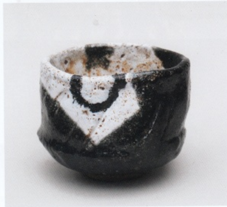
Yves de Block, Chawan, 2025; steengoed, black Oribe; h. 9,5 cm, Ø 12 cm