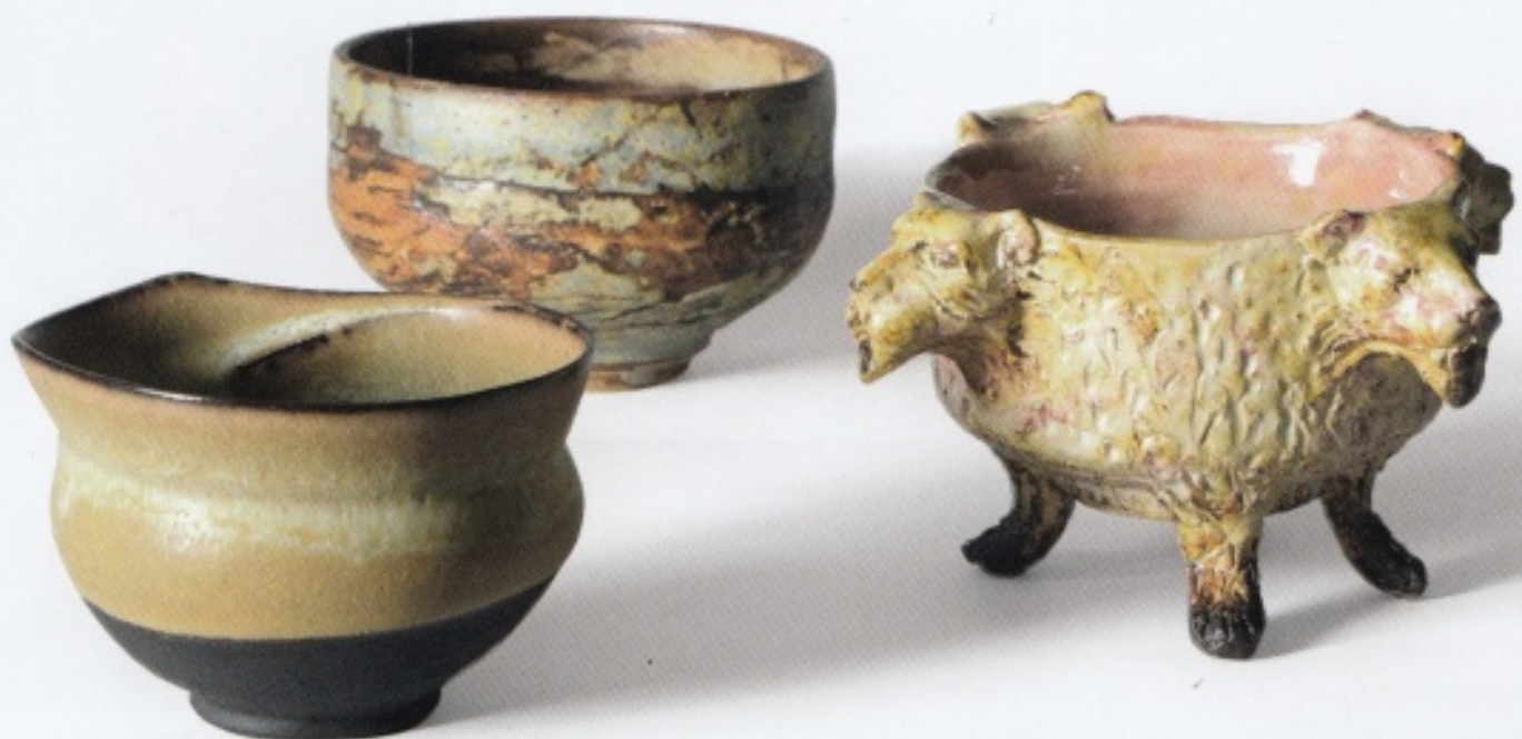
v.l.n.r.: Chawans van Annemarie Vogel, 2025; steengoed, h. 8 cm, Ø 12 cm | Job Heykamp, 2025; steengoed; h. 9 cm, Ø 14 cm | Saskia Pfaeltzer, 2025; steengoed; h. 10,5 cm, Ø 19 cm.

De chawan is meer dan alleen een kom; hij is het hart van de ceremonie, een kunstwerk met een persoonlijk verhaal. De keuze voor een bepaalde chawan hangt af van wat past bij iemands handen, iemands temperament en diens schoonheidsbeleving, maar ook het seizoen en de sfeer die men wil creëren spelen een rol. De kom kan ruw of glad zijn,