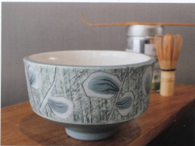
Annet Leichel, Chawan , 2025; ingekleurd porselein; h. 7 cm, Ø 12 cm

De deelnemende kunstenaars gingen op mijn uitnodiging aan de slag, waarbij ook dwarsverbanden ontstonden. Op