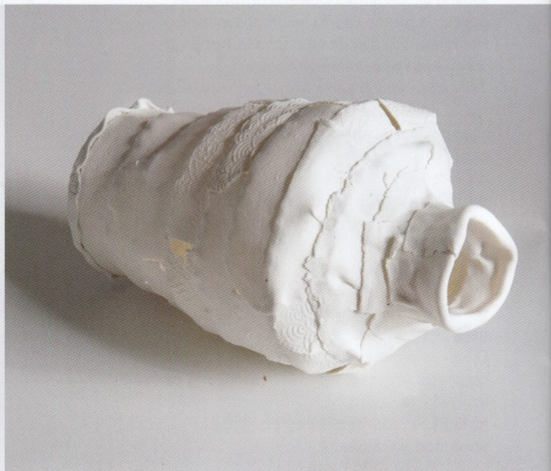
Annemarie Vogel, Zwart Licht , 2023; porselein; h. 33 x 18 x 18 cm